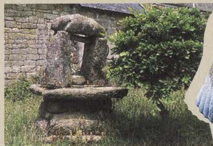
Vieux puits à Quelfennec - Lignol