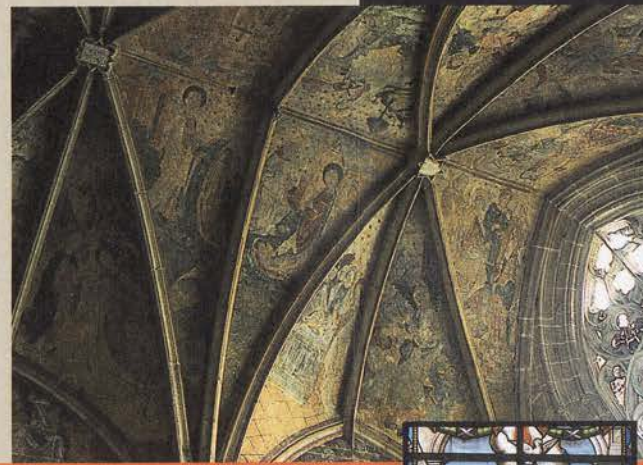
Peintures murales - Notre-Dame de Kernasclédén

Le pays de Guémené est également connu pour la beauté naturelle de ses paysages, qui comblera les amateurs de belles promenades tout autant que le passionné de pêche.