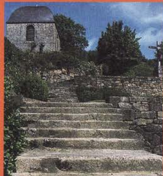
Clocher de l'Église de Guéméné-sur-Scorff

De tout temps, on a reconnu aux habitants du Guéméné, connus sous le nom de "Pourlets", une originalité parmi ceux des cantons du Vannetais, à la fois par leur parler, leur costume et leur danse.