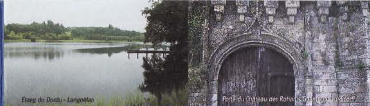
Etang du Dordu - Langoëlan