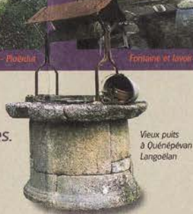
Vieux puits à Quénépevan Langoëlan

Vous admirerez particulièrement Notre-Dame de Kernasclédén et ses peintures murales exceptionnelles. Le pays de Guémené est aussi remarquable pour la richesse de son art roman.