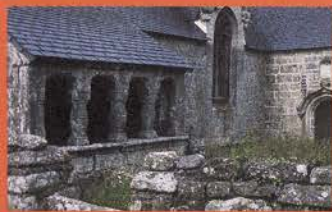
Osuaire de la Chapelle Saint-Guen - Saint-Tugdual