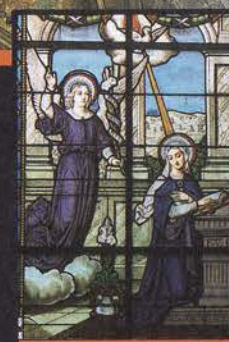
Vitrail de Notre-Dame de Penly - Persquen

Le pays de Guémené est également connu pour la beauté naturelle de ses paysages, qui comblera les amateurs de belles promenades tout autant que le passionné de pêche.